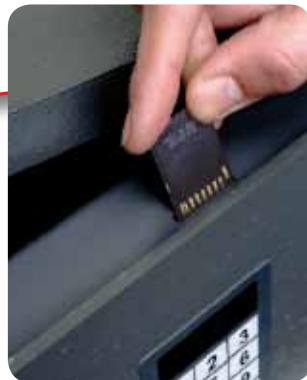
Historique des opérations téléchargeable