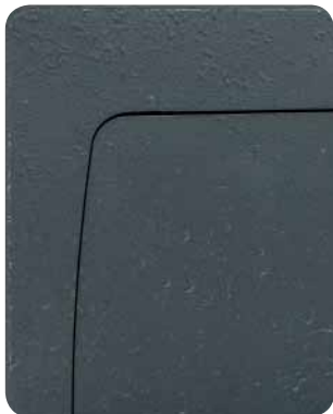
Découpe laser pour une ligne moderne et une sécurité maximale