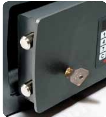
Ouverture mécanique d'urgence à clé