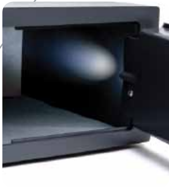
Éclairage intérieur automatique