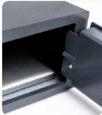
Ouverture à 90° pour faciliter le positionnement d'un ordinateur portable