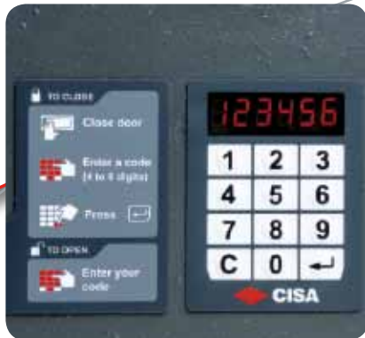
Facilité d'utilisation avec instructions visuelles et clavier conforme ADA